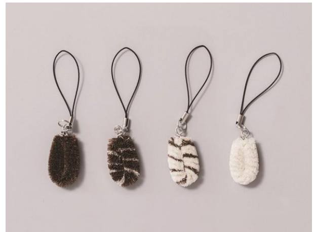
たわしストラップ

館内にはスターバックスコーヒーも出店し、静かに本を読む場所という従来の図書館のイメージとは大きく異なる“賑わう図書館”として、1月中旬には来館者数が40万人に達する見込みです。カプセルトイの販売機は、子どもが図書館に来たくなる動機付けのひとつとして開館当初より設置しています。